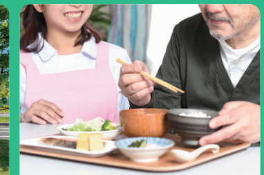
医療関連サービス