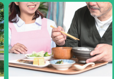
医療関連サービス